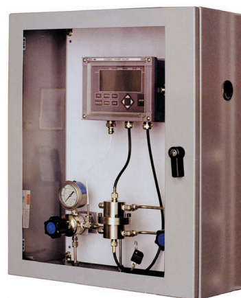
Анализатор водорода СНА в защитном кожухе

Изомеризация – Определение концентрации водорода в изомеризационных процессах важно с нескольких точек зрения. Для примера: оптимизация отношения концентрации водорода к концентрации углеводородов обеспечивает стехиометрический баланс; появляется возможность определить, когда в производственном процессе происходят какие-либо нарушения; возможно определить чистоту рециркулирующего газа с точки зрения устранения утечек; контролировать чистоту водорода; определять степень поглощения водорода в побочных реакциях с примесями, например, в случае насыщения бензина.